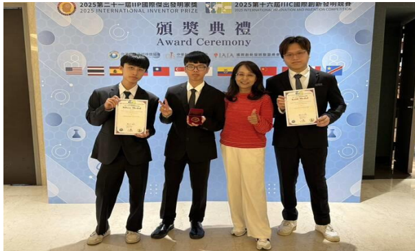
行銷系2025國際創新發明競賽獲1金1銀