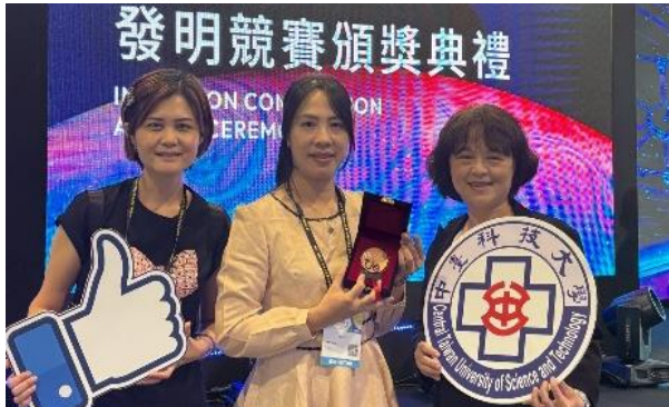
護理系2025台灣創新技術博覽會獲銅牌發明獎