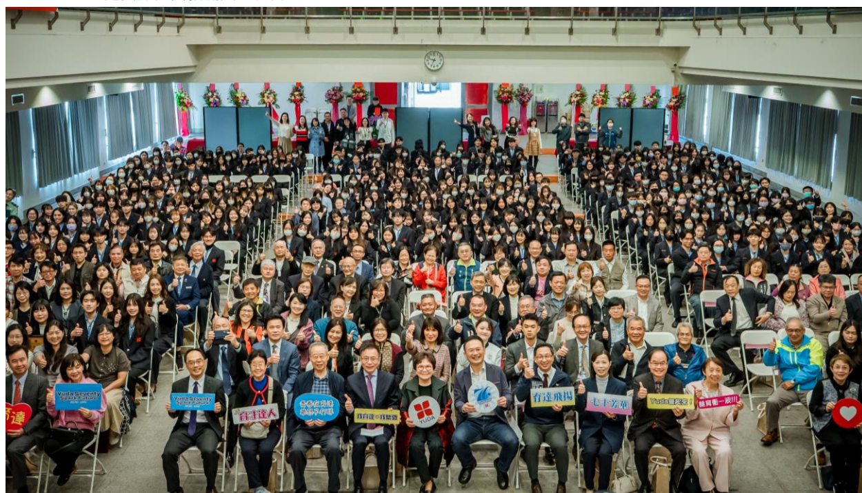
桃園市育達高中歡慶70周年校慶，慶祝大會熱鬧非凡