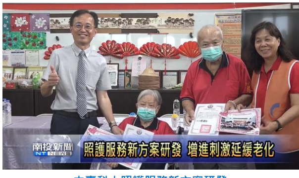
中臺科大照護服務新方案研發