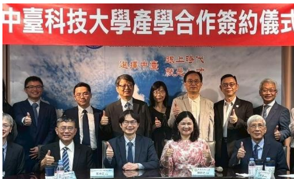
中臺科大與中醫大市醫產學合作簽約儀式