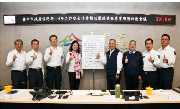
114年臺中市消防工作安全衛生政策宣言