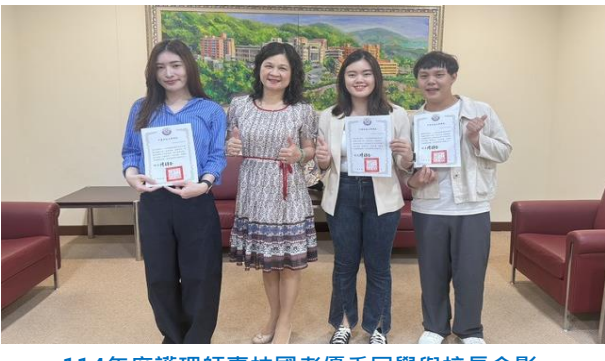
114年度護理師專技國考優秀同學與校長合影

中臺科大以專業能量發揮社會影響力，肩負臺中市幼教公共服務能量，受市府委辦托嬰中心訪視輔導、豐原親子館、2間居家托育服務中心計畫，並經營管理3所非營利幼兒園，推動幼教公共服務及福利，展現幼托專業的影響力。在終身教育方面，獲委辦臺中市東區長青學苑、2所社區大學、4所樂齡學習中心等多項社教計畫，提升公民教育與社區發展。在公共安全領域，獲委辦四個地方政府消防人員職業安全衛生服務計畫，強化消防人員健康照護，推動安全管理制度，為消防人員建立身心安全防線。在社區長照方面，獲委辦「預防及延緩失能照護服務」、「健康活力gogogo模組師資增能研習」及「Keep活力Keep肌力五告讀方案模組師資人才培育工作坊」等計畫，研發照護服務方案，培訓中部師資近兩百人，所研發模組全國使用率達六成以上，對預防及延緩長輩失能照護服務，產生相當正面效益，深獲各界肯定及讚賞，協助各級政府建構敏捷、韌性健康照護體系。