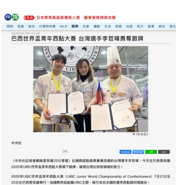
食科系學生獲世界盃西點大賽新聞