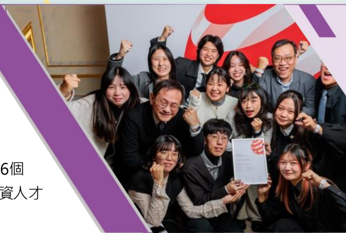
南應大視傳系 師生前往德國紅點品牌暨傳達設計獎領獎

在「文創」與「實作」領域已居領先地位的台南應用科大，此次以提供年終獎金的實際行動鼓勵全體教職員工的努力。未來，學校將持續優化軟硬體設施與薪資福利，不僅要成為學生夢想的起點，更要成為台灣高等教育界中，教職員工最嚮往的幸福職場。