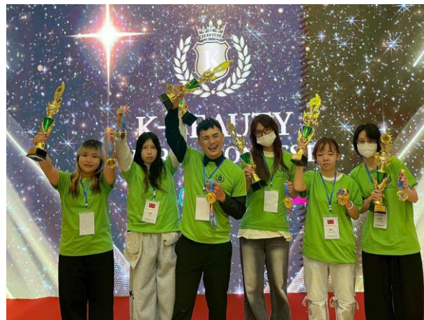
南應大美容系-國際賽事再傳捷報！「2025_K- BEAUTY_WORLD_CONTEST」大賽摘九金