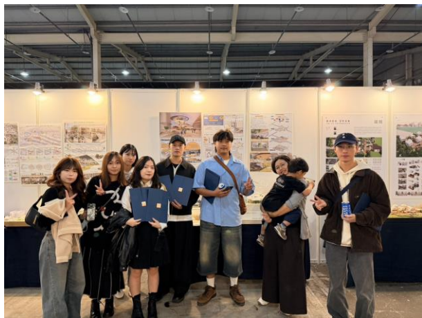
南應大室內設計系-台中設計週TFSD未來空間設計競 賽表現亮眼_榮獲建築組金獎與多項肯定