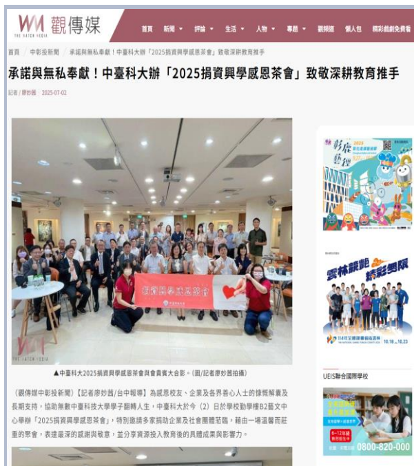
2025捐資興學感恩茶會新聞