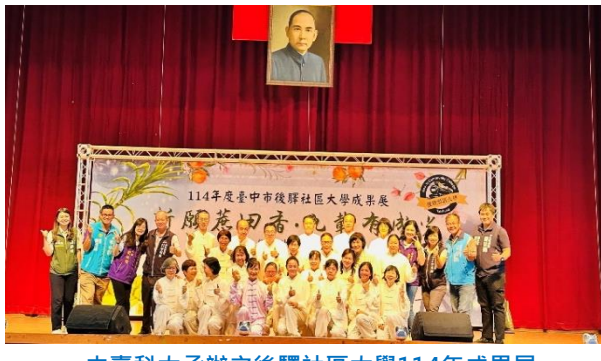
中臺科大承辦之後驛社區大學114年成果展