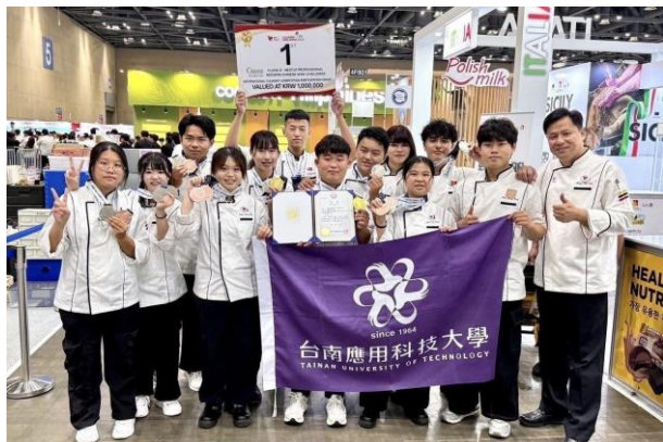
餐飲系同學參加2025 韓國SFH食品飯店烹飪挑戰賽 榮獲2金牌10銀牌10銅牌3佳作及1項全場最高分獎