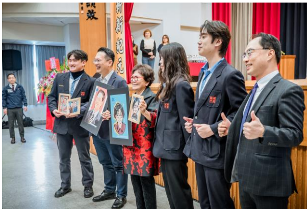
設計群學生將畫像致贈給蘇副市長及蘇董事長