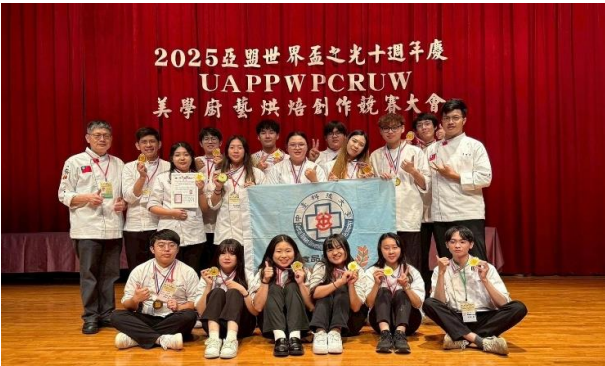
食科系2025 UAPP WPC競賽獲13金3銅

中臺科大學生於國內外競賽屢獲佳績，展現跨領域整合與創新實作能力。在專業證照方面，114年度護理師及格率達81.55%，牙技師及格率達55.36%，均遠高於全國平均，並誕生多位國考前十名學生，成果亮眼。在國際與全國競賽中，食品科技系表現尤為突出，於2025 UAPP WPC世界盃美學廚藝烘焙創作競賽榮獲13金3銅，在臺灣食品產業創新競賽中以「防災米能量Max+」榮獲全國第二；牙體技術暨材料系學生於2025牙體形態雕刻大賽奪下第一名；護理系學生研發「保冷功能收納袋」獲臺灣創新技術博覽會銅牌。師長表現亦備受肯定，徐育鈴老師獲臺中市SUPER教師殊榮、呂哲維老師榮獲2025日本國際亞洲餐飲挑戰賽金牌。這些成果展現出中臺科大對「技術專業、人文關懷、永續創新、社會服務」教育理念的具體落實。