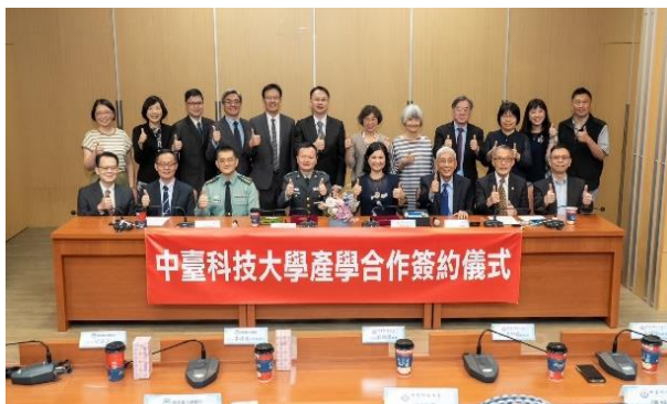
中臺科大與國軍臺中總醫院產學合作簽約儀式