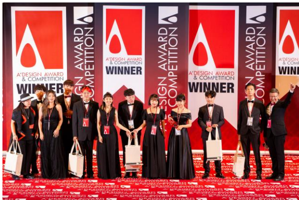
南應大商品設計系 連年榮獲A'_Design_Award國際設計大獎