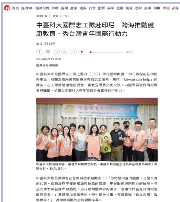
後護系國際志願隊赴印尼新聞

展望未來，中臺科大將持續強化「大健康產業創新轉型」之專業人才培育模式，深化AI素養教育、擴增跨域實作場域、推動智慧決策治理，並以更緊密的產官學合作提升教育影響力。未來將透過打造具國際競爭力的智慧大健康人才培育基地，體現中臺科大教育理念「以技術專業為根基，以人文關懷為核心，以永續創新為方向，以社會服務為使命」，並以積極、創新與韌性的策略，迎接高教轉型，繼續以教育回應社會，以專業創造價值，成為引領臺灣健康產業與永續發展的重要力量。