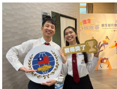
112年聽僑生說故事 創意短片競賽獲獎

另為實現108年開始實行之「成就每一個孩子--適性揚才、終身學習」發展全人教育精神的課綱目標，108學年度兼顧學生適性需求，本校開設餐飲管理、美容、觀光事務建教合作班，同年配合國家新南向政策，亦開始招收僑生，經過三年努力，本校建教合作學程已成為中部地區規模最大，人數最多的學校，各項評比優異，屢獲教育部、僑委會、各大學、國中及家長肯定，未來仍將持續精進，投入更多用心及關注，期使每位學生均能展現自我、適性發展，以培育福智雙修、術德兼備、具專業技能之棟樑之材。