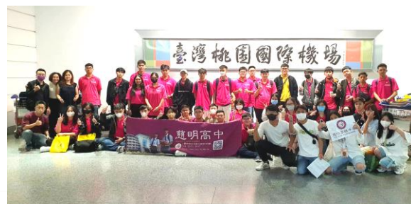
慈明高中僑生專班，跨越國界的專業力量