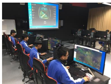
慈明高中電子商務科 鏈結商務物流智慧生活體驗

為配合國家社福政策發展，本校108學年度成立照顧服務科，結合大專院校與醫療專業機構，從理論與實務引導學生認識長照趨勢，以培育長照人才，回饋社會。