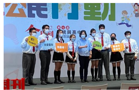
第八屆總統與慈明學生面對面論壇

慈明高中日間部現設有資訊、航空電子、電子商務、餐飲管理、觀光事務、應用日文、幼兒保育、照顧服務、美容等科；實用技能班設美顏技術、烘焙食品、餐飲技術三科；進修部設有餐飲管理科。多元科別滿足學生適性選擇。