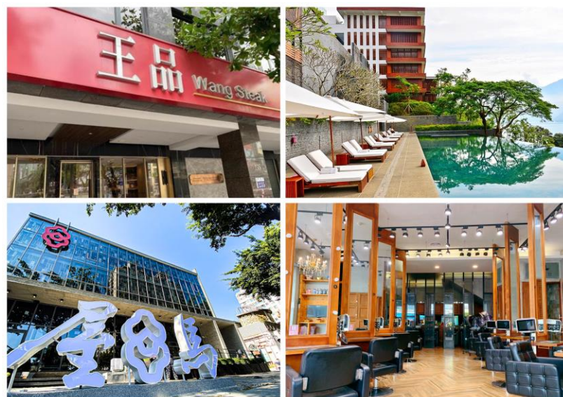
建教合作優質廠家 (左上)王品(右上)涵碧樓(左下)屋馬燒肉(右下)斯朵利專業髮型美容