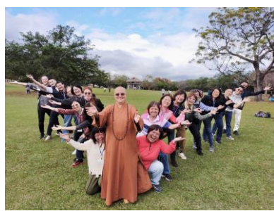
慈明高中以人為本共創輝煌