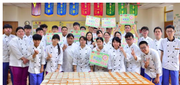
慈明高中餐飲技術科證照達人，3年考取10張證照

另為實現108年開始實行之「成就每一個孩子--適性揚才、終身學習」發展全人教育精神的課綱目標，108學年度兼顧學生適性需求，本校開設餐飲管理、美容、觀光事務建教合作班，同年配合國家新南向政策，亦開始招收僑生，經過三年努力，本校建教合作學程已成為中部地區規模最大，人數最多的學校，各項評比優異，屢獲教育部、僑委會、各大學、國中及家長肯定，未來仍將持續精進，投入更多用心及關注，期使每位學生均能展現自我、適性發展，以培育福智雙修、術德兼備、具專業技能之棟樑之材。