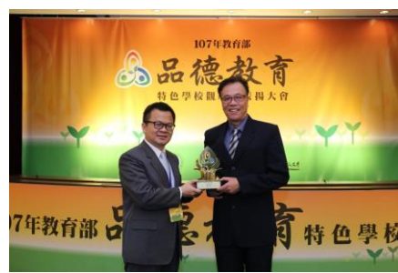
慈明高中榮獲教育部品德教育特色學校