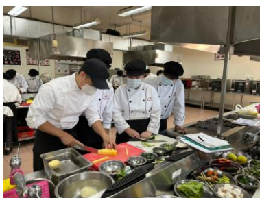
慈明高中餐飲管理科 業師傳授專業技術