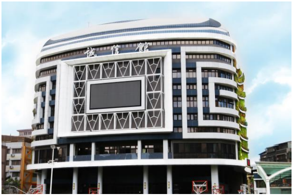
新建多功能智慧教學大樓-誠信館