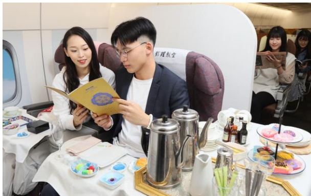
打造模擬機艙，進行體驗教學

除專業知識與能力培養外，致理更注重品德教育，強調態度至上，除了將職場倫理列為必修外，進一步成立「致商書院」，培育具誠信、敬業、團隊合作、熱心與倫理等「才德」兼備的新商務管理人才。而品德教育方面的努力，則榮獲教育部全國品德教育、生命教育、服務學習、友善校園等績優學校，更連續12 (100-111)年榮獲教育部頒發「品德教育推廣與深耕學校」、7度 (103-105、108-111)年榮獲「三好校園實踐學校」，並2度榮登「三好校園典範學校」殊榮；111年度更榮獲教育部「生命教育特色學校」，也是全國唯一獲獎大專校院，以及教育部111年度「友善校園卓越學校」等榮譽。