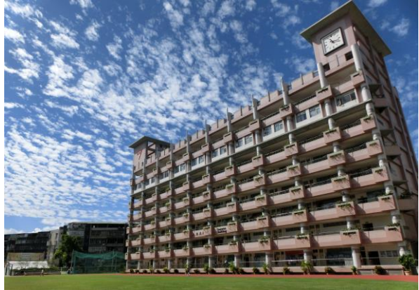
綠意盎然的校園環境