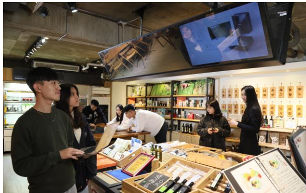
結合智慧科技，建置未來超市