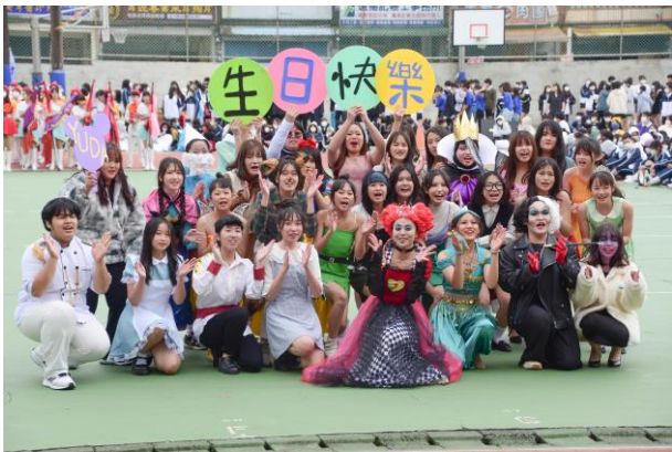
校慶活力創意進場