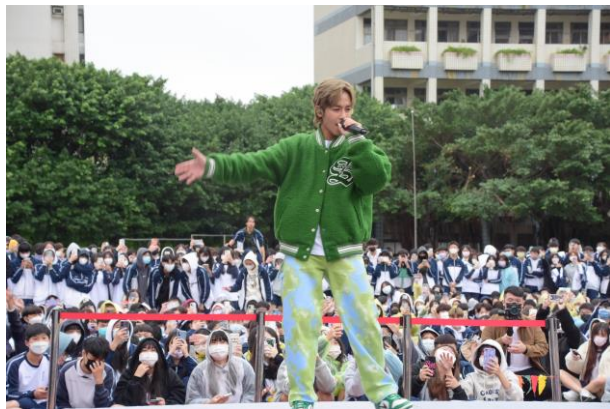
校慶演唱會大牌雲集

會唸書也要會玩，校園社團、校隊選擇多樣化，為校園生活著上色彩，校慶運動會、軍歌比賽、健康操比賽、才藝競賽，激發團隊精神、凝聚班級向心力，「飢餓12」活動，為人道救援發聲；校慶演唱會大牌雲集，與藝人接觸零距離。外語群浴衣體驗、聖誕、跨年節慶活動深入體驗文化；餐旅群餐飲觀光週，說菜藝術活動策畫，快樂、專業第一，家政群科時尚秀、幼兒闖關活動，職場提早接軌。