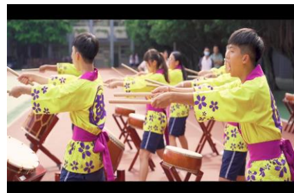
國際文化實際體驗