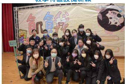
飢餓12為人道救援發聲