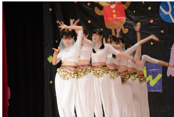
才藝競賽，展現自我