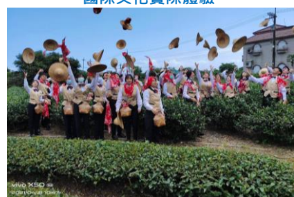
快樂學習專業出發