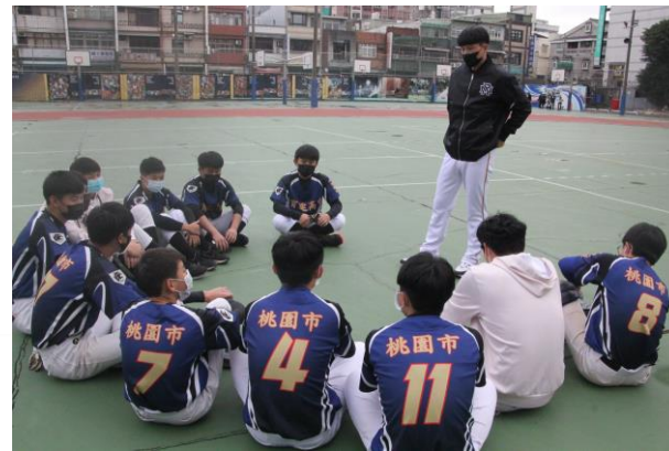
棒球隊與樂天隊員相見歡