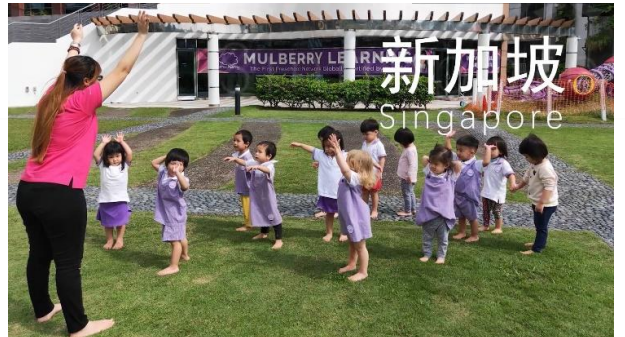
幼保科學生獲教育部海峽計畫赴新加坡實習