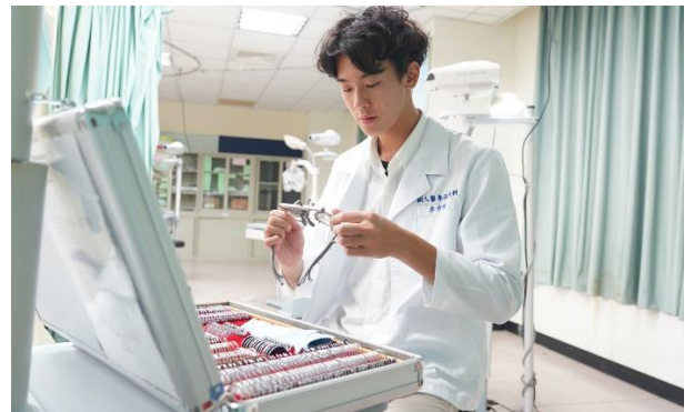
充實的教學設備—屈光量測後眼鏡插片試戴