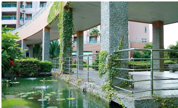
綠意盎然的生態校園