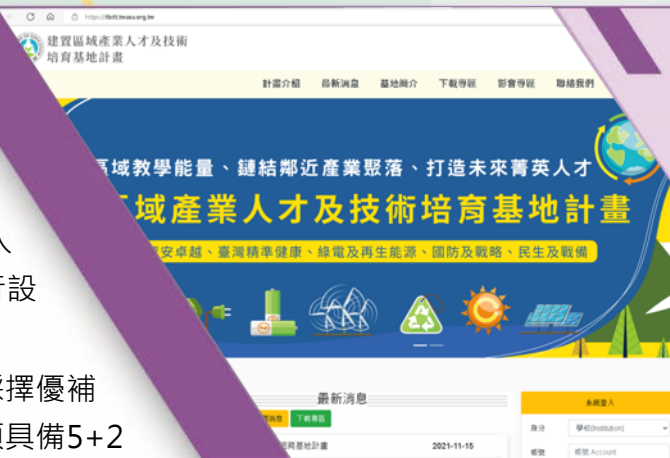
建置區域產業人才及技術培育基地計畫 核定名單

教育部為配合投資青年就業方案，培育專業技術人才，以六大核心戰略產業為主軸，打造以產業實際作業環境為模組之實作場域，投入24億元經費，推動建置區域產業人才及技術培育基地計畫，自111年至114年預計成立二十個基地，由各公私立大專校院進行設立。