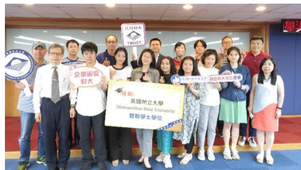
6位學生錄取美國州立大學及日本星城大學，與家長一同分享喜訊