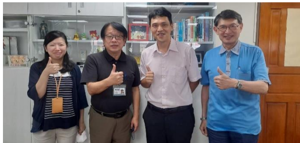
資訊科技系、資訊管理系與知名電腦公司合作，建構優質實習環境