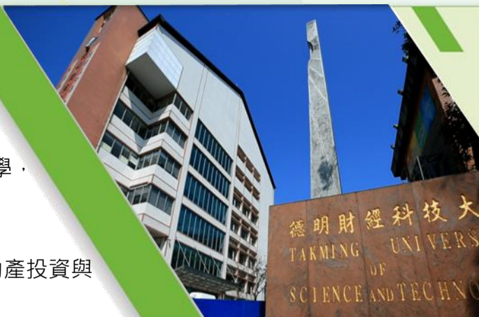
學校鄰近內科技園區，交通便捷