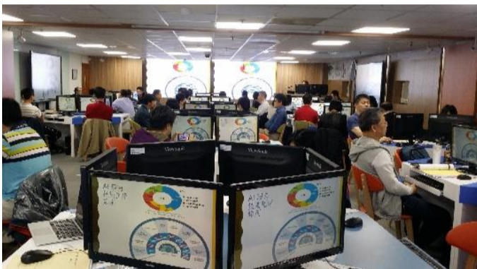
建置「金融電質暨 AI 實習基地」，培訓數位科技人才

為因應數位科技驅動創新社會與追求永續發展的世界趨勢，本校以建構「新商務大學」為目標，並以「數位科技」與「永續發展」為兩大核心發展重點，藉由數位科技完善數位教學、數位行政、數位知識；遵循聯合國永續發展目標，善盡大學社會責任，期以培育優質之財經數位人才成為永續社會之精英。