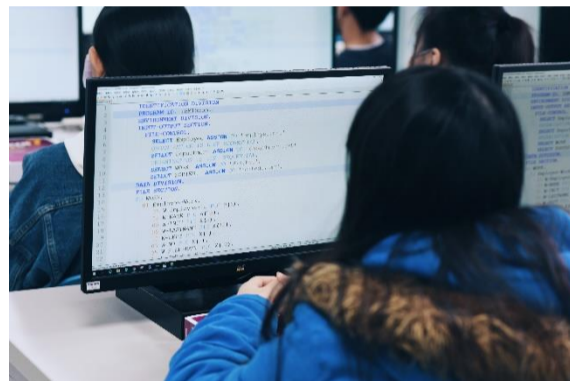
舉辦「金融程式語言人才培訓營」，培育金融科技生力軍