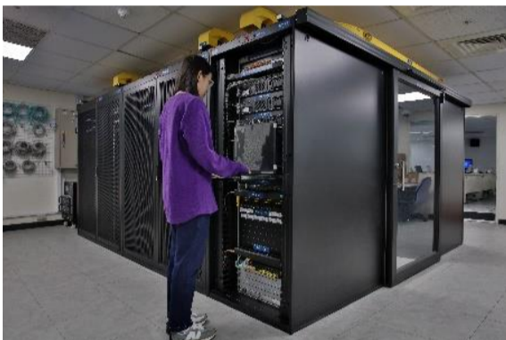
設置全國唯一網路資料中心實訓基地