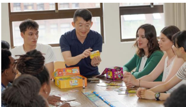
大葉大學推動雙語教學