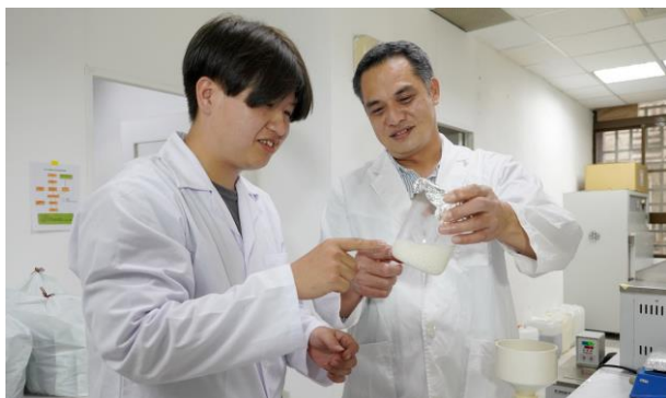
大葉大學研發基地提供實作學習場域

大葉大學從創校時期的5個學系，一步一腳印，成長為彰投雲嘉學院規劃最完整的綜合大學，34年來為產業培育了無數優質人才，未來大葉大學師生也將持續開創新價值。