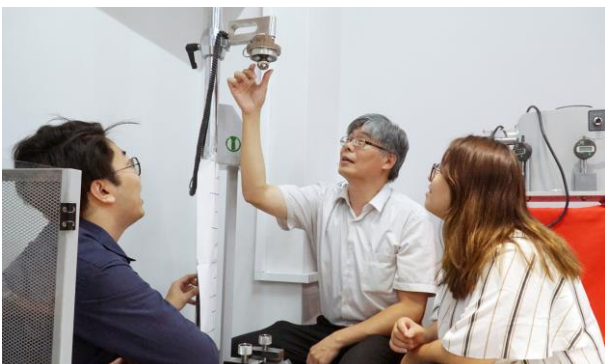
大葉大學七大特色研發基地幫助學生接軌產業