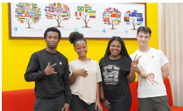
國際學生在大葉開心學習