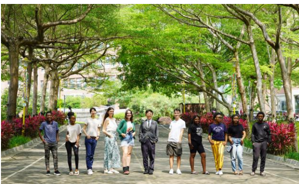
大葉大學吸引許多國際學生前來就讀