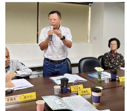
與會貴賓及會員學校分就私校面臨問題踴躍發言