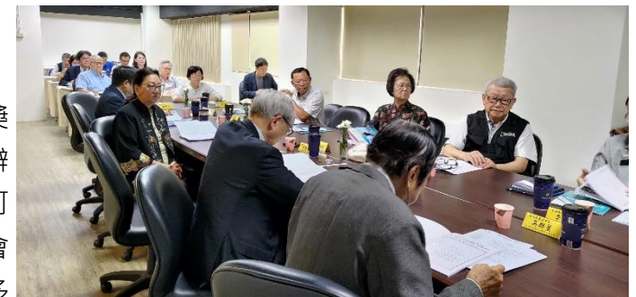
第七屆第十次理事會議暨第九次監事會議實況