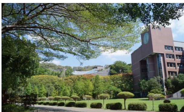
大葉大學蟬聯世界綠色大學評比私校第一

一方面透過工作坊，提升教師多元教學技巧與英語授課品質，引發學生學習興趣，強化知識應用的英語能力，另一方面，以學生為主體，積極建置全英語的學習環境，在宿舍舉辦英語學習活動，透過跨文化和時事議題，引導學生進行口語表達，拓展國際視野，學校也開設了英語口語能力提升課程，提升教職員的英語溝通能力，幫助教職員能夠與國際生對話，提供更加國際化的學習環境，讓學生能夠更好地適應全球化挑戰，提升國際競爭力。