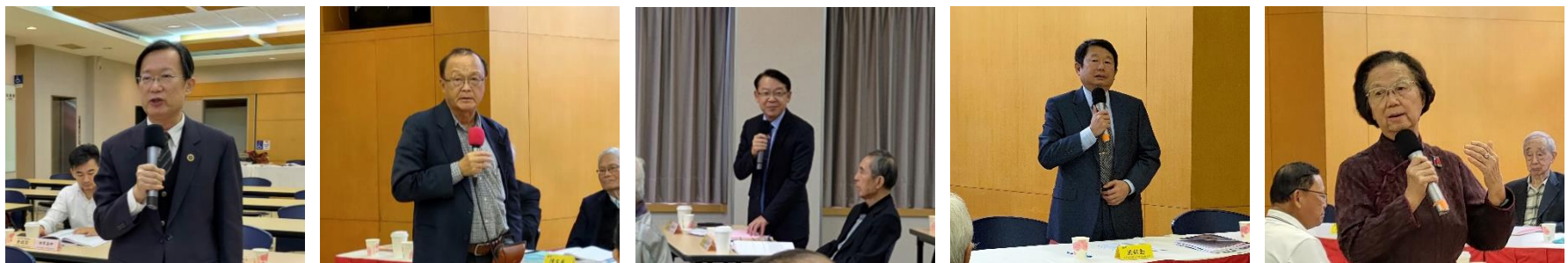
與會貴賓及會員學校分就私校面臨問題踴躍發言

此次會議在理監事及會員學校代表互相交換意見及熱烈討論的氛圍中圓滿結束。後續本會將持續參與各重要教育議題之評估與討論，並提出具體政策建議，以期教育主管當局將私立學校之聲音納入未來擬訂教育政策之依據，也歡迎本會所有會員學校提供相關教育議題之意見與建議，以利本會彙整後，提出具體之政策建議與執行重點。