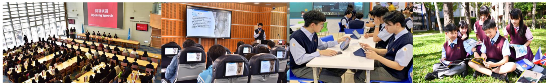
多元適性 / 全人教育【南山中學】提供全方位的教育、運用數位、探索學習，讓不同特質的孩子，都能發展興趣與潛能！

本校教學大樓皆有不同的教學功能，提供學生多元的學習空間。大型閱覽室、實驗室、體育館、健身房、舞蹈教室、樂活空間、大師工坊、天馬劇場、創意教室、情境教室、數位圖書館、e化教室及人文講堂。每項設備都強化教與學的品質。全校每間教室裡均有完善的教學設備，包含數位講桌、電子白板、無聲廣播、節能中央空調及二氧化碳偵測器，提供學生優良的學習環境。南山藝廊，是學校的一大特點，定期舉辦各種藝文展覽，讓學習沉浸在美感之中，提升學習溫度。