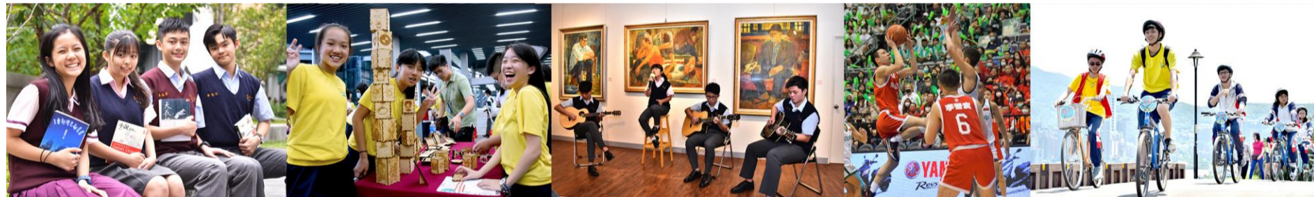
多元適性 / 全人教育【南山中學】適性揚才、啟發孩子的學習動機。追求夢想，成就未來！

南山學子在各方面的表現也常有令人激賞的成績，例如新北市及全國的語文競賽、科學展覽、音樂、美術比賽、英語歌唱及話劇比賽等項目中，經常有傑出的表現；啦啦隊、舞蹈競賽也常獲得全國獎項；而籃球隊更曾獲得過七座HBL冠軍的榮耀，是全國高中籃壇的一支勁旅。學校不僅希望學生擁有豐富的知識，更透過校內將近100個社團，分為學術、服務、藝術、體育、技藝、康樂六大範疇，為每位學生培養興趣，讓具有各項才華及潛力，得以適性發展。