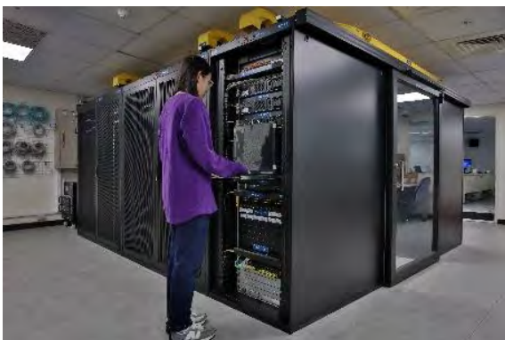
·設置全國唯一網路資料中心實訓基地