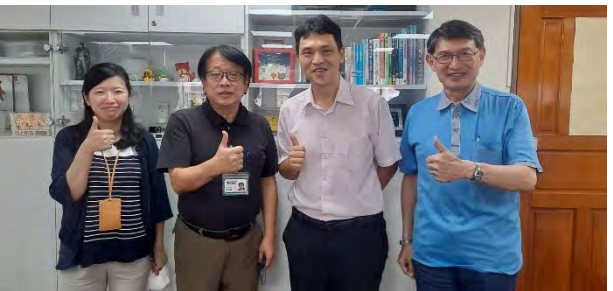
·資訊科技系、資訊管理系與知名電腦公司合作，建構優質實習環境