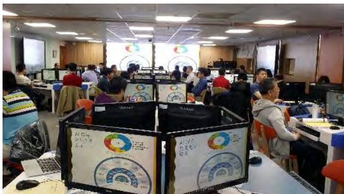
·建置「金融電質暨 AI 實習基地」·培訓數位科技人才

為因應數位科技驅動創新社會與追求永續發展的世界趨勢，本校以建構「新商務大學」為目標，並以「數位科技」與「永續發展」為兩大核心發展重點，藉由數位科技完善數位教學、數位行政、數位知識；遵循聯合國永續發展目標，善盡大學社會責任，期以培育優質之財經數位人才成為永續社會之精英。