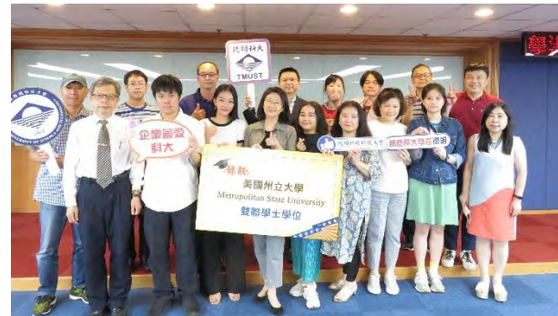
6位學生錄取美國州立大學及日本星城大學，與家長一同分享喜訊