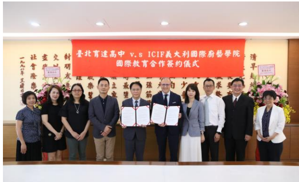
臺北育達高中重視國際交流 是臺灣首間與ICIF義大利廚藝學院合作的高中職校