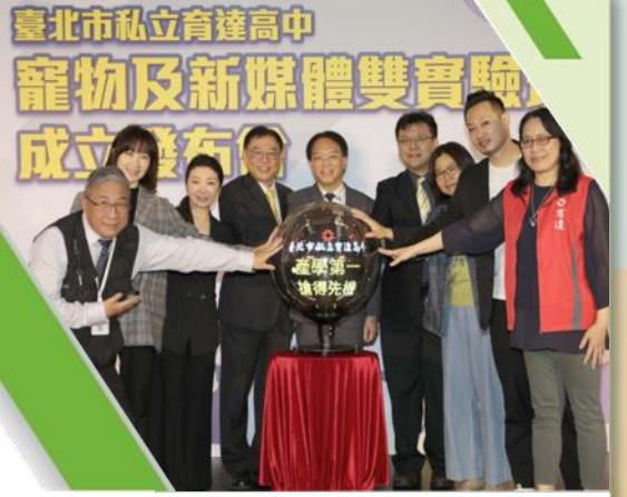
瞄準產業市場環境與就業趨勢，臺北育達高中創全國先例增設「寵物造型設計實驗班」與「新媒體影視設計實驗班」

臺 北育達高中由王創辦人廣亞博士於民國三十八年創辦，校址位於臺北市松山區寧安街，鄰近臺北小巨蛋捷運站，交通便利、四通八達。創校迄今已有七十三年歷史，培育畢業生共近三十萬人。育達設科符合時代潮流及社會所需，設有餐飲管理科、多媒體設計科、表演藝術科、時尚造型科、觀光事業科，以及餐飲管理科輪調式建教班、烘焙實務廚藝班、電競數位遊戲設計班，於112學年度學年度更通過臺北市政府教育局核准，創全國先例增設「寵物造型設計實驗班」與「新媒體影視設計實驗班」，瞄準產業市場環境與就業趨勢，培育更多優秀產業專才。現今我們將更積極推展雙語教學、國際教育，以符應本校「適性揚才，全方位培育國際技職達人」之教學目標，培養適應新世代且全方位，並具競爭力、創造力、前瞻力的世界公民。