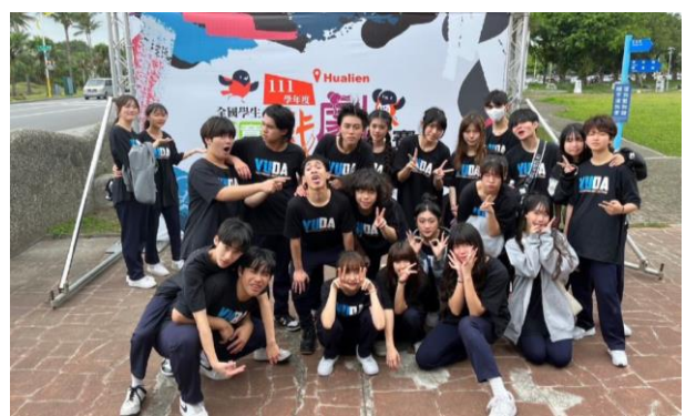
表演藝術科榮獲111學年度全國學生創意戲劇冠軍