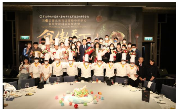
餐飲管理科連續五年 前進臺北喜來登大飯店舉辦畢業成果展