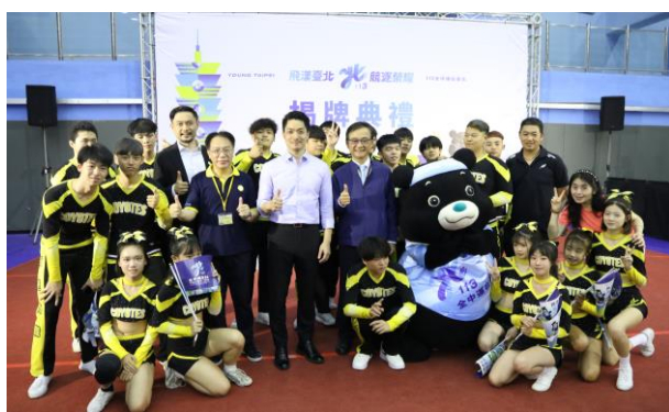
競技啦啦隊受邀擔任113年台北全中運揭牌典禮表演團隊