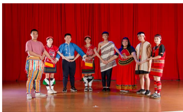
數十種特色社團打造學生精彩豐富的校園生活

快樂的校園生活一定少不了精采的社團活動，臺北育達高中擁有數十種特色社團，還有競技啦啦隊、排球隊、籃球隊等各式專業校隊，不僅豐富同學們的校園生活體驗，更是陶冶學生身心，培養技藝專長及自治精神的絕佳管道。此外，為培養學生具備良好的儀態、品德、涵養，我們更積極推行校園品格教育，由師生攜手共同響應發票募捐、愛心捐血、飢餓三十、食物捐獻、公益路跑、擁抱獨老義煮活動、臺北市參與式預算課程、愛心園遊會等活動，提升學生對於公共事務的關注，將「做好事、說好話、存好心」之三好精神在校園內落地生根，並在參與過程中學習到比讀書更重要的事，成為「專業第一、品德優先」的未來人才。