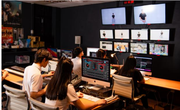
「新媒體影視設計實驗班」為臺灣產業投注更多關鍵人力