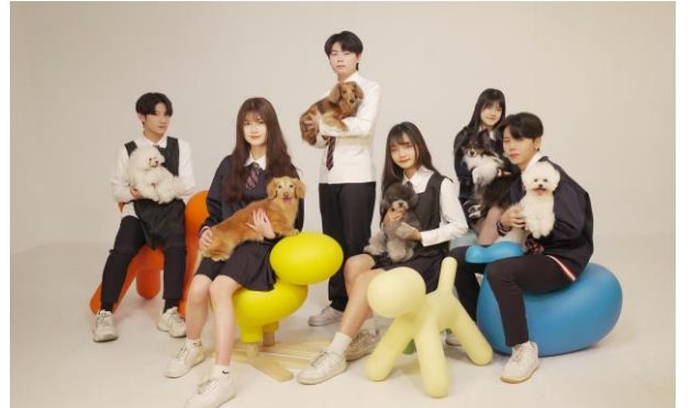
「寵物造型設計實驗班」打造全方位時尚美學人才