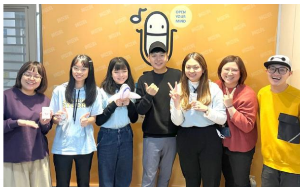
觀光事業科具備國際航空、遊程規劃、領團實務、餐旅服務四大類專業課程，協助學生備戰未來變身職場關鍵人才

本校餐飲管理科是全國唯一連續五年前進臺北喜來登大飯店舉辦畢業成果展的高中職校，「輪調式建教專班」與各大五星級飯店及連鎖餐飲集團合作，更榮獲109年度建教合作考核一等，教學績效備受肯定；多媒體設計科著重媒體整合創作、2D動畫、3D動畫、平面設計、影片後製、遊戲、電競、攝影等跨領域能力，不僅與PC國際大廠宏碁合作「電競數位遊戲設計班」，新成立之「新媒體影視設計實驗班」更有望為臺灣產業投注最關鍵人力；表演藝術科具備完善的展演實務課程、頂尖的教學環境與強大的業界連結，學生熱情專業的良好口碑是電視節目、網路節目、廣告、戲劇、音樂MV、經紀公司最愛合作對象，於升學進路方面亦有亮眼之成果展現；時尚造型科以時尚美學為導向，結合彩妝、髮藝、美甲、飾品等專業領域課程，更延伸「以美為本」之精神，開設「寵物造型設計實驗班」，打造全方位時尚美學人才；觀光事業科是全國第一所重視英、日、韓、泰語第二外語能力的高中職校，並導入觀光旅遊、遊程規劃、國際航空、餐旅服務等實務課程，帶領學生成為跨國際的觀光領航員！