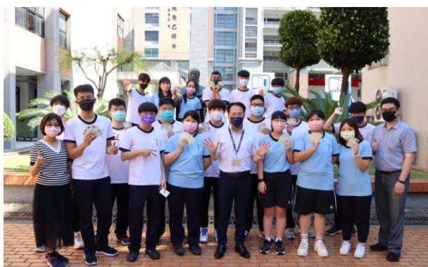
臺北育達高中積極培養學生 成為「一證多照」之專業人才