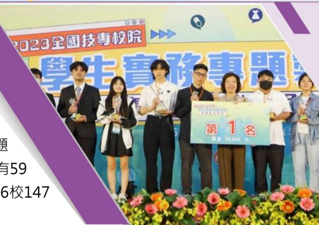
全國技專校院學生實務專題製作競賽暨成果展私立學校獲獎情形一覽表