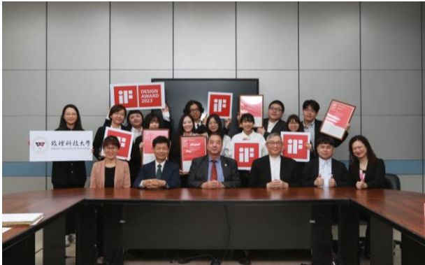
2023 iF 設計獎獲獎團隊

致理早從98學年度即開設全英文會展活動管理學分學程，實施全英語授課（簡稱EMI），110學年已開設至少20門專業領域的全英語課程。此外，也透過多種海外交流形式，如短期交換研修、雙聯學制、國際志工與英語研習團等方式，與國際接軌。學生可透過教育部學海飛颺計畫，申請到海外進行語言研修外，亦透過「學海築夢」及「新南向學海築夢」等計畫，前往墨西哥、巴拉圭、日本等國實習，瞭解當地企業營運模式與培養國際視野，並爭取到畢業後直接留任海外就業機會。