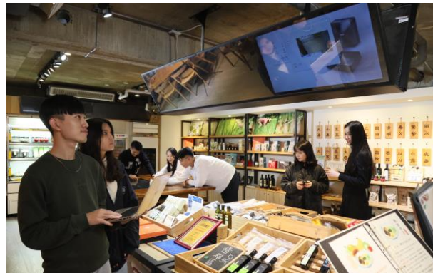
結合智慧科技，建置未來超市