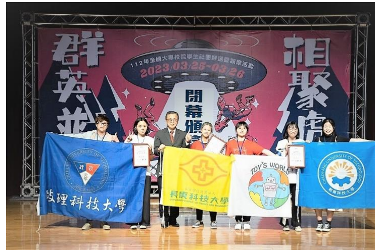
教育部學務特教司司長吳林輝(左三)出席頒獎活動