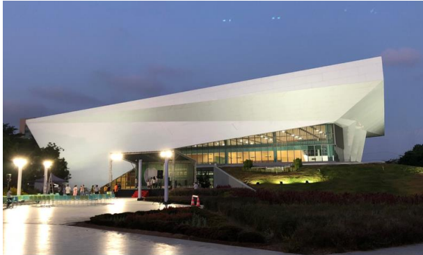
多功能活動中心夜景

本校以「仁慈博愛·樹人樹德」為校訓，配合德、智、體、群、美、技六育平衡發展的國家教育方針，以及國家發展如醫療、管理、語文、婦幼政策的需要，來設計本校之科系課程架構，並發展出具有特色的醫護管理科系。禮聘優良師資，充實教學設備，積極爭取社會資源，全力提升教學水準。教育英才，是本校教育的最高理念；加強學生生活教育，發展學校重點特色，兼顧科技專業與人文素養，營造樹人樹德的優雅品德，建立充滿人文氣息、幸福友善的優質學府。