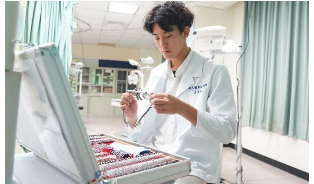
充實的教學設備—屈光量測後眼鏡插片試戴