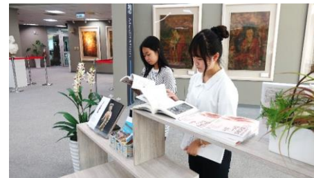
圖書館—藝文閱覽區