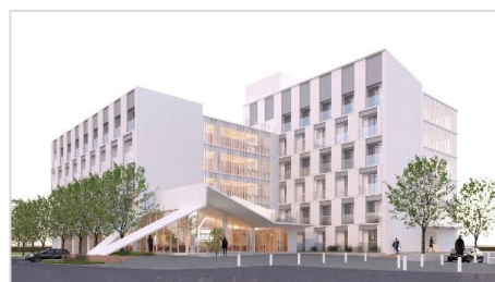
新建宿舍完工示意圖(預計112年6月完工)