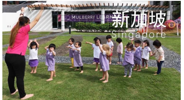
幼保科學生獲教育部海峽夢計畫赴新加坡實習