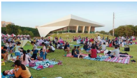
舉辦草地音樂會 開放學校場域