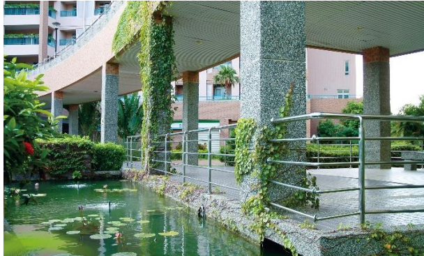
綠意盎然的生態校園