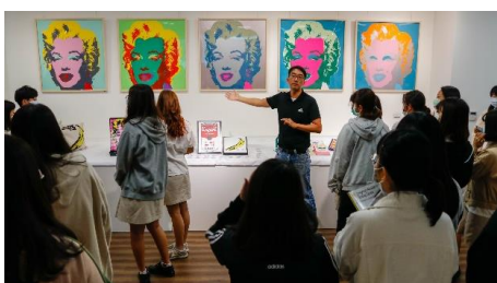
藝術走入校園—策展中心經常舉辦藝文展覽