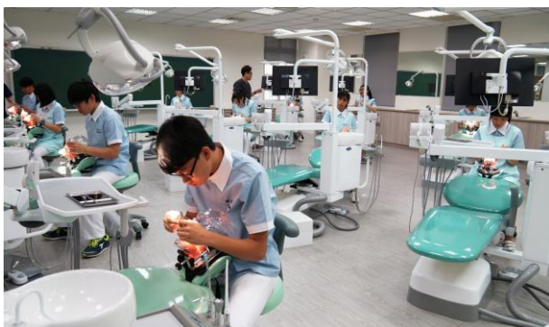
臨床口腔衛生實驗室

在「健康活力、快樂學習」的校風下，本校各項表現優異，亦積極推動國際交流、免費的證照輔導、畢業後無縫接軌的就業轉銜，讓在校師生、畢業校友以樹人為榮。相信未來每個樹人畢業的學子，皆是術德兼備的醫事文化人才，期許在未來皆為社會棟樑，造福人群也光耀樹人。