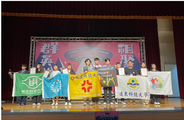
獲獎學生頒獎實況