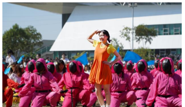
美保科活力四射的校慶開場表演