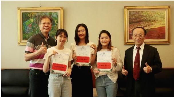
牙體技術師國考狀元、榜眼、探花都在樹人