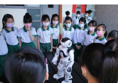
NAO機器人化身老師，講解魚菜共生的原理

對應聯合國SDGs「消除飢餓」指標，資訊課程透過編寫程式，讓NAO機器人化身老師，講解說明魚菜共生的原理。英語課程「未來農業」老師帶領學生觀察學校設置的「魚菜共生系統」，以探究學習的方式引導學生分析如何透過共生系統打造永續供應蔬果的環境。在職涯探索課程中也安排營養師帶領學生參觀學校中央廚房，讓學生瞭解營養師的工作範疇、食物的來源及營養成分，培養孩子們惜食的概念。學校探索體驗教學中心也帶領孩子走出教室，感受環境與生活的關聯，安排同學參觀農場，體驗親手插秧的辛勞及樂趣，並且以「零廚餘」為目標，小隊分工合作從規劃、採買食材到完成炊事，進而培養珍惜食物的觀念。