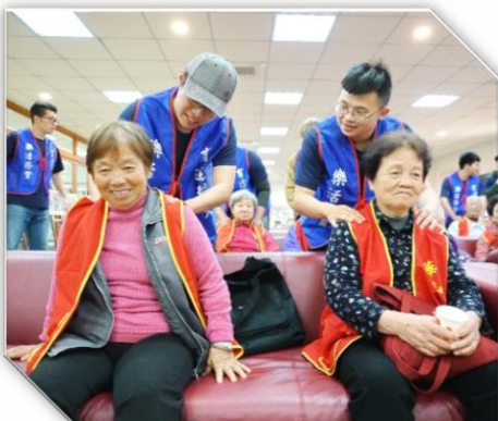
· 期待跨部會整合長照人才及照顧機構之制度

綜上，長照人力及人才的欠缺是目前國家所面臨的重大問題，單憑教育部所提出的免學雜費政策，無法解決當前困境。至盼教育部及衛福部虛心瞭解學生、學校、照服機構及整體產業的需求與建議，力求突破法令限制，提供更多誘因，藉以建構可長可久的長照人才政策。