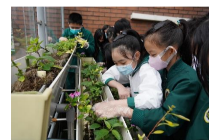
推動魚菜共生系統，進行食農教育，對應聯合國SDGs「消除飢餓」指標