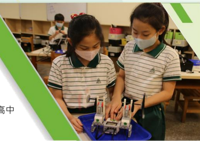
激發學生的好奇心，從而提高學生的創造力和動手操作能力

校址：臺北市敦化南路1段262號 官網： https://www.fhjh.tp.edu.tw/