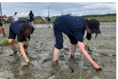
帶領孩子走出教室，感受環境與生活的關聯