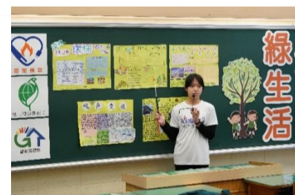
五年級成果發表—全民綠生活