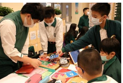
鼓勵孩子成為創造改變的永續行動家