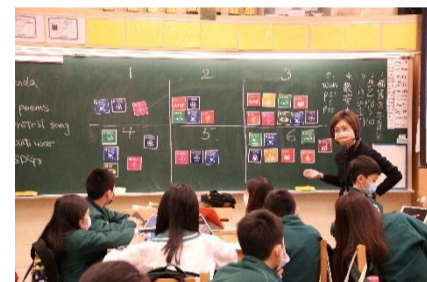
音樂老師從歌詞引導思考戰爭的本質