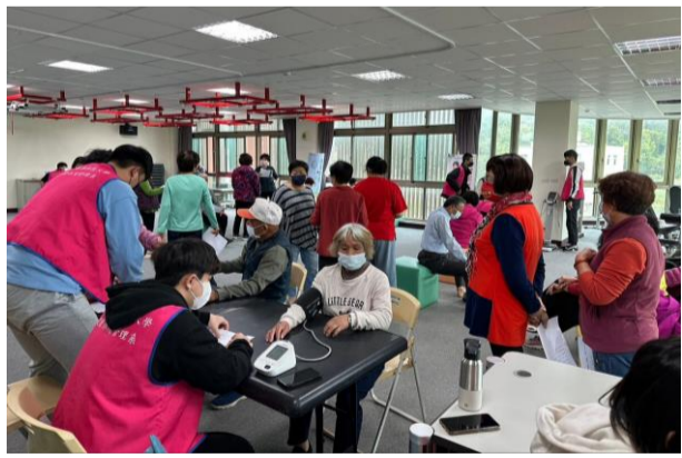
元培積極推動大學社會責任實踐計畫 健管系師生也發揮所長善盡大學社會責任