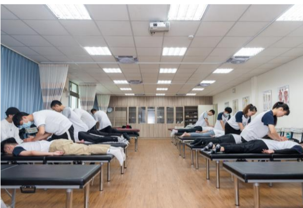
整復推拿專業教室也是國家證照考場