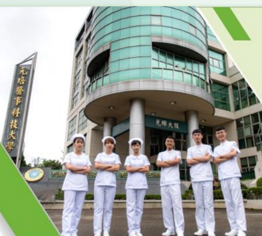
醫護健康人才培育基地

光宇學校財團法人元培醫事科技大學，簡稱元培醫事科技大學，創辦於1964年，是全台灣第一所培育醫事技術人才之專門學校，創校60年來始終秉持創校人蔡炳坤先生「倡導生命科學教育，培育醫事技術人才」的目標，致力於醫技科學教育的提升及醫事科技的發展，以及預防保健及生醫健康產業人才的培育，落實「健康福祉·服務人群」之使命，成為台灣重要的「醫護健康人才培育基地」。培育之校友遍及海內外各大醫療院所與企業，表現獲得各界好評，人力銀行企業最愛大學調查中，在生命科學學群及醫藥衛生學群畢業生表現名列前茅。