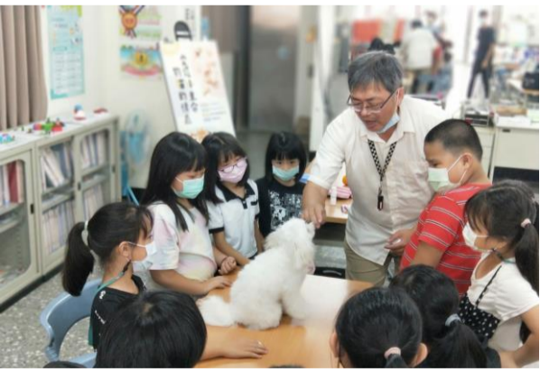
元培打造香山兒童友善社區計畫 以寵物寵物為媒介，激發學童尊重生命關懷社區