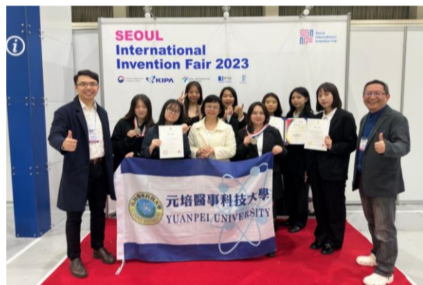
2023年韓國首爾國際發明展，元培師生勇奪2銀1銅佳績

學生的實習合作企業超過100家，並有機會參與跨國實習或交換學生計畫，如日本、美國、瑞士、新加坡、馬來西亞、越南、德國等地，有助提升學生的國際移動力及就業競爭力。