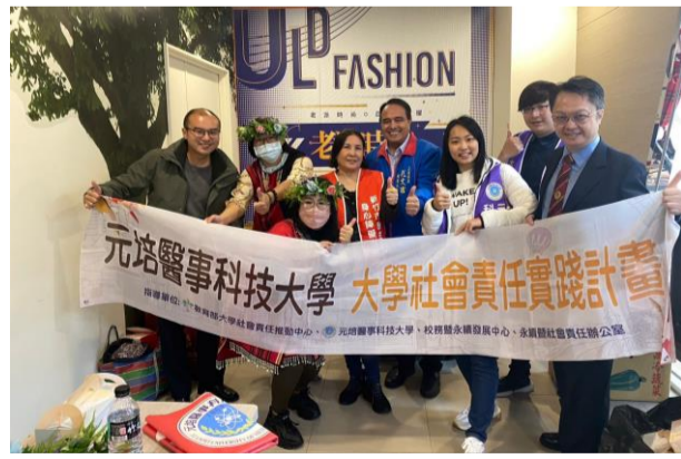
元培大學社會責任計畫 調查原住民傳統草藥和健康促進概念

整合各學院系專長，推動健康城市計畫、高齡友善城市計畫以及食安五環計畫等政策，讓元培的專業品牌成為協助政府政策的後盾，也讓學生在學習的過程中充分體驗到「做中學、學中做」的技職特色，更使實作經驗成為畢業生就業時最大的競爭資本。