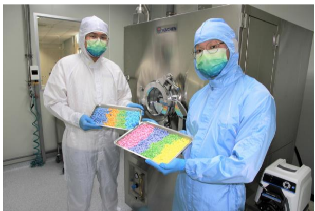
模擬藥廠培育學生在校實作力畢業即戰力