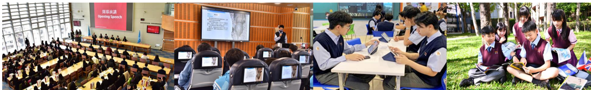
多元適性 / 全人教育【南山中學】提供全方位的教育、運用數位、探索學習，讓不同特質的孩子，都能發展興趣與潛能！

本校教學大樓皆有不同的教學功能，提供學生多元的學習空間。大型閱覽室、實驗室、體育館、健身房、舞蹈教室、樂活空間、大師工坊、天馬劇場、創意教室、情境教室、數位圖書館、e化教室及人文講堂。每項設備都強化教與學的品質。全校每間教室裡均有完善的教學設備，包含數位講桌、電子白板、無聲廣播、節能中央空調及二氧化碳偵測器，提供學生優良的學習環境。南山藝廊，是學校的一大特點，定期舉辦各種藝文展覽，讓學習沉浸在美感之中，提升學習溫度。